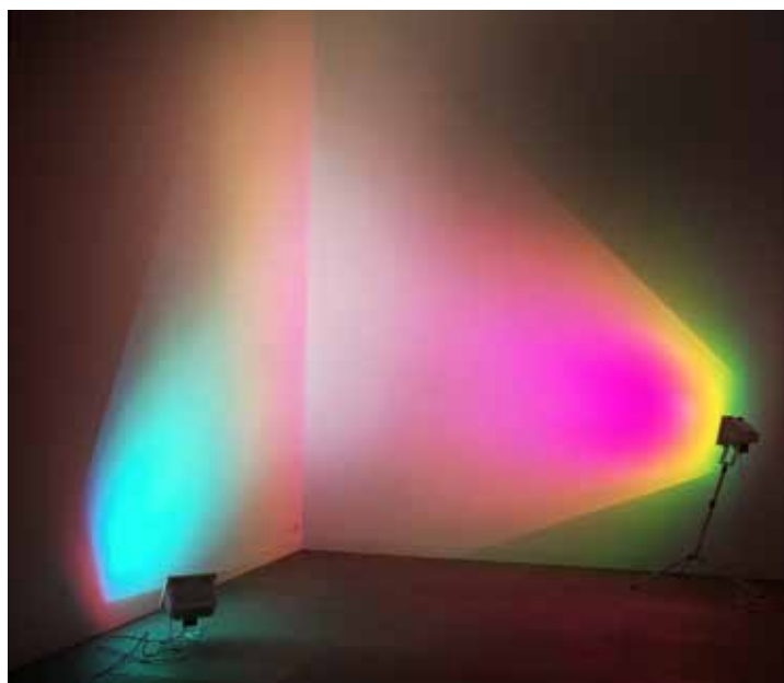
© Ann Veronica Janssens, Hot Pink Turquoise, 2006, 2 lampes halogène 750/1.000 watt, filtre dichroïque couleur, 1 trépode.